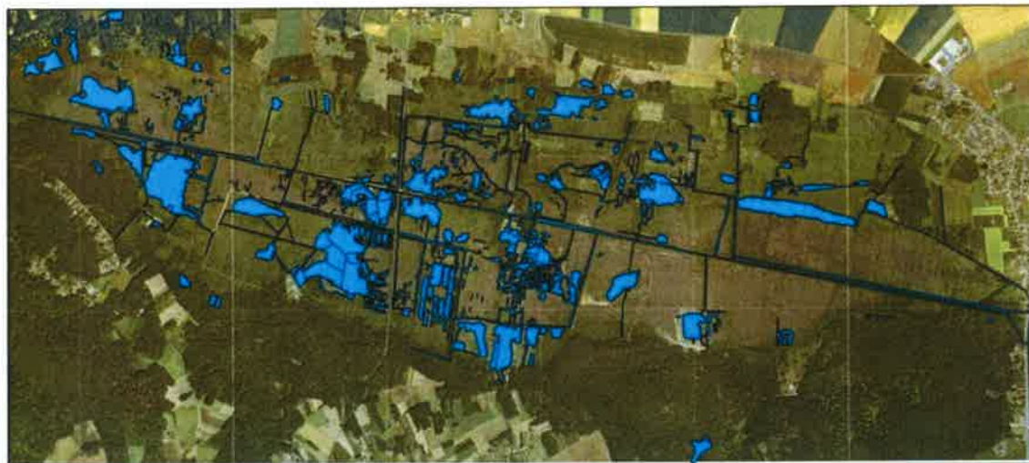
Réseau hydraulique du Marais de Sacy

Ces différents usages ont façonné le paysage actuel des marais, laissant notamment des grandes pièces d'eau, des fossés drainants rectilignes et de nombreux puits artésiens.